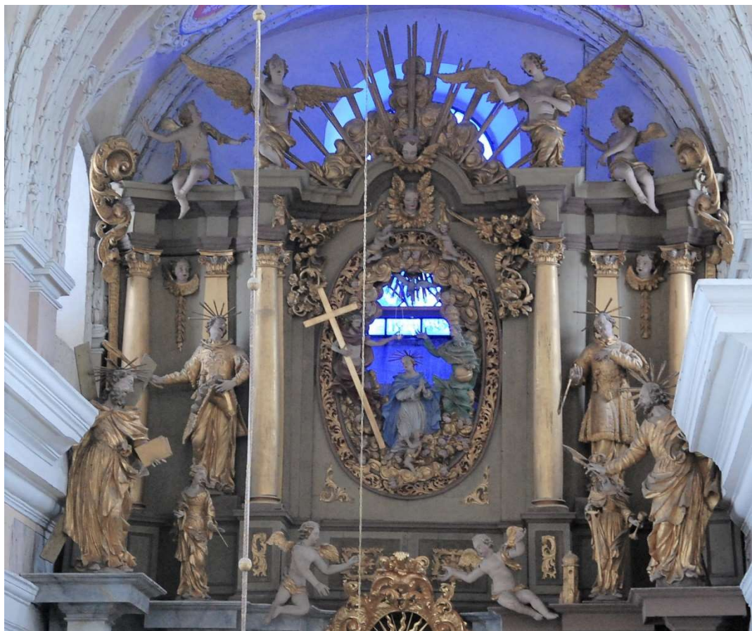
Górna kondygnacja ołtarza głównego w Kruszyń, stan na 12.2022 po częściowej konserwacji środkowej partii nastawy ołtarza.