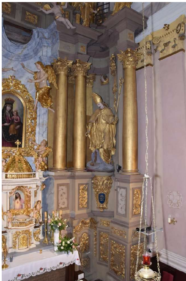
Część centralna i cokołowa , strona południowa ołtarza głównego w Kruszyń, stan na 12.2022 po konserwacji środkowej części nastawy ołtarza.