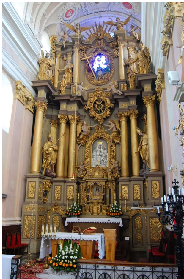
Ołtarz główny kościoła p.w. Św. Macieja w Kruszynie, stan przed konserwacją.